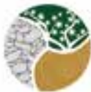
ΔΗΜΟΣ ΚΑΡΠΕΝΗΣΙΟΥ MUNICIPALITY OF KARPENISSI